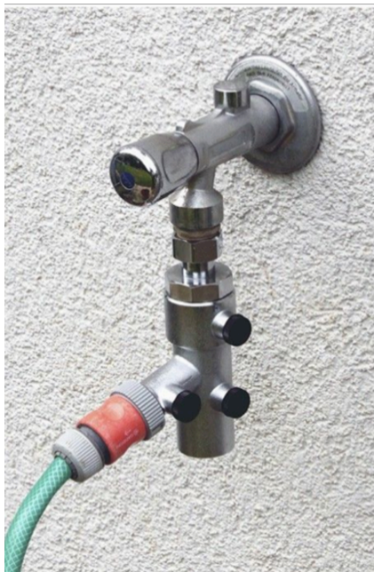
Εικόνα 1: π.χ. διαχωριστής συστημάτων BA295STN της Honeywell