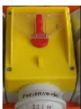
slika 2: Glavna sklopka