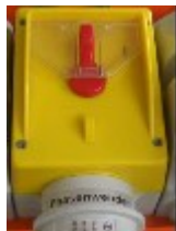
Pav. 2: pagrindinis jungiklis