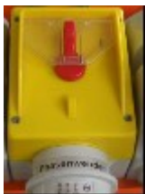
Afbeelding 2: Hoofdschakelaar