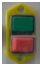
Slika 2: Glavno stikalo