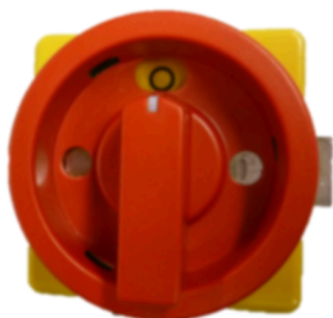
Figura 1: Întrerupătorul principal

Sunt instalate următoarele dispozitive de siguranță: