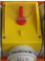
图 2: 主开关