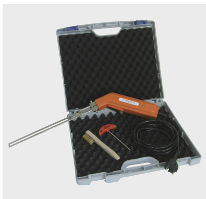
PFT MINICUT 230 mm na mala