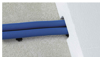
... para a projeção de um sistema de condutas.