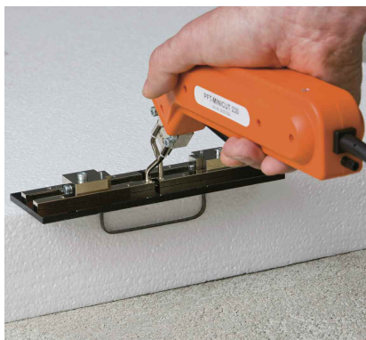
PFT MINICUT 230 mm com adaptador de corte em perfil